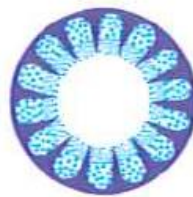
Kanta kosmetik berwarna